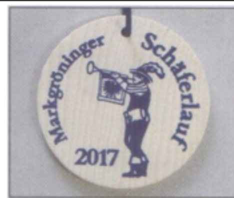
Badge d'entrée au Schäferlauf C'est en page 3 que cela se passe...