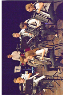
Au Galet - Concert par le Handharmonika-Club de Markgröningen