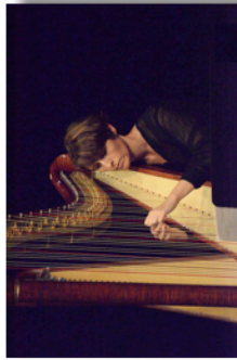
Au Galet - Harpiste de l'Ecole de Musique