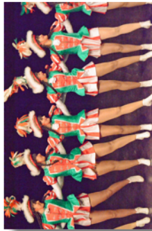
Au Galet - La chorégraphie des Majorettes de la Fasnet-Gilde