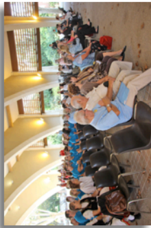
Ouverture des festivités sous la Grande Halle - Le public