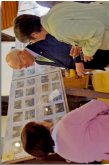
Exposition philatélie avril 2014 Markgröningen