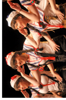
Au Galet les Majorettes de la Fasnet-Gilde