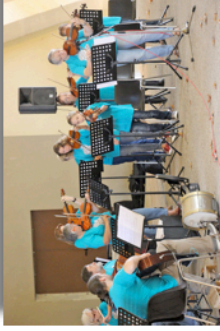
Ouverture des festivités sous la Grande Halle par La Malle aux Arts