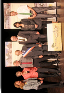
Au Galet les délégations officielles