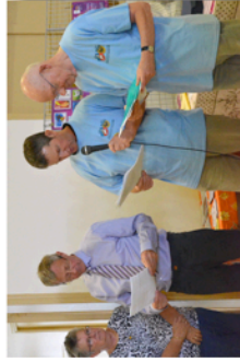
Exposition philatélie à St-Martin Inauguration par les présidents