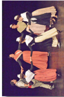
Au Galet - Danse provençale par Li Coudelet Dansaire