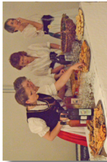
Préparation de l'apéritif-dinatoire par les Landfrauen