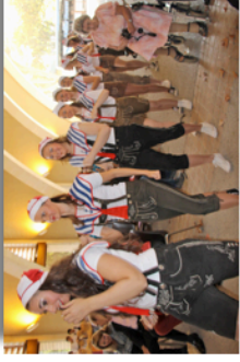
Sous la Grande Halle, défilé des Majorettes de la Fasnet-Gilde