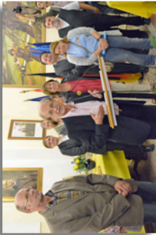
Accueil en mairie de St-Martin par M. le Maire et les élus