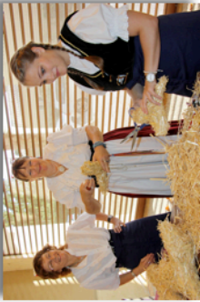
Artisanat présenté par les Landfrauen sous la Grande Halle