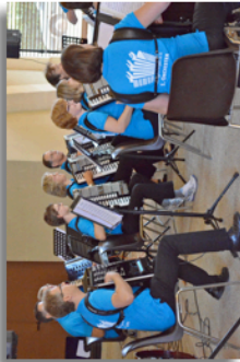
Ouverture des festivités sous la Grande Halle - Le Handharmonika-Club